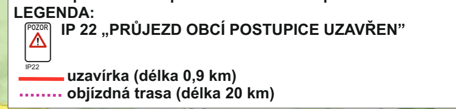
Schéma dopravního značení: přechodná úprava SDZ, na silnici č. III/1123, uzavírka z důvodu opravy komunikace mezi obcemi Postupice a Popovice - III. etapa.